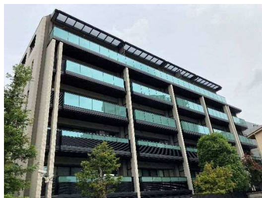
＜第1号認定されたパークホームズ駒沢大学＞

※2 マンション管理適正評価サイト https://www.mansion-evaluationsystem.org/