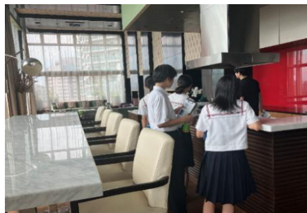
マンション内ラウンジ見学の様子