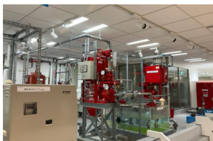
すまラボ内の消火栓等展示設備