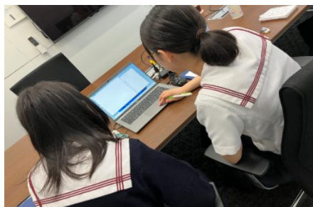
管理組合への提案体験ワークの様子